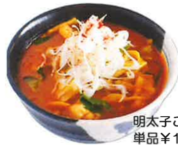
明太子ご飯付き¥1,540円(税込み) 単品¥1,210円(税込み)

春キャベツと牛モツの辛味噌タンメン 濃厚なものの旨味が溶け込んだ 特性辛味噌スープ