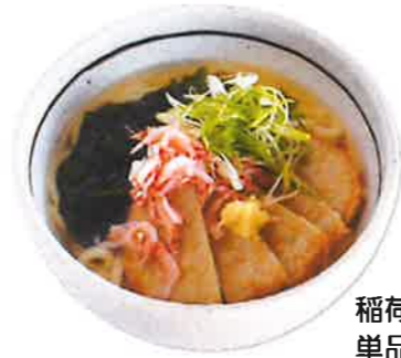
稲荷付き¥1,320円(税込み) 単品¥1,100円(税込み)

春キャベツと牛モツの辛味噌タンメン 濃厚なものの旨味が溶け込んだ 特性辛味噌スープ