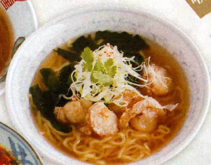
02 ホタテとワカメ ラーメン