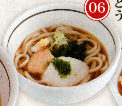
06 とろろ うどんコロ