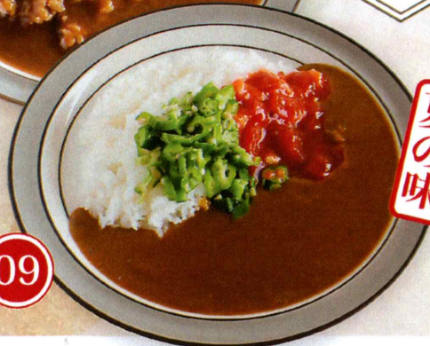
09 トマトオクラ カレー