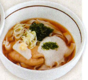
07 とろろ きしめんコロ