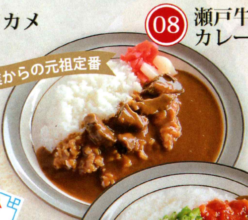
08 瀬戸牛 カレー