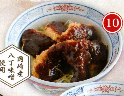
10 味噌 カツ丼