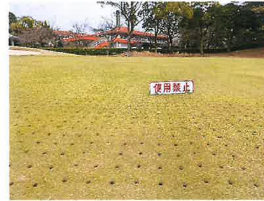
18番ホールメイングリーン

◎メイングリーン更新作業 毎年この時期（4月上旬）に行っておりますグリーンの更新作業が開始されました。芝の成長の為、年間を通して良い状態を保つ為に必要な作業です。練習グリーン、コースメイングリーン終了後、コースサブグリーンも行います。更新作業中来場者の皆様にはご迷惑をお掛け致しますがご理解、ご協力お願い致します。