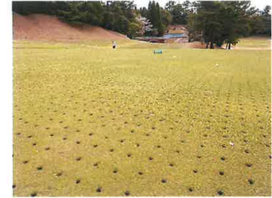
12番ホールメイングリーン

◎2番ホールクロスバンカー改修工事 カート道路側バンカー内を掘り下げる工事を行っております。